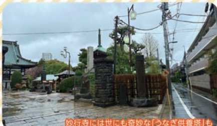
妙行寺には世にも奇妙な「うなぎ供養塔」も