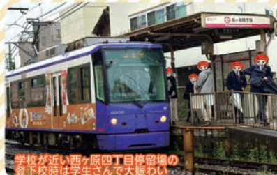
学校に近い西ヶ原四丁目停留場の登下校時は学生さんが大賑わい